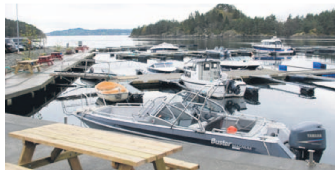
Ombo har 250 innbyggere og er 56 km 2 stor med oppmerkede turløyper og 2 gartneri med blomsterutsalg. God service får du av Karin på den lokale Joker-butikken på Eidsund kai.